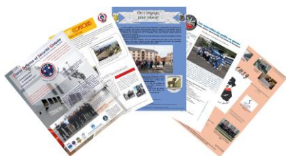
Illustration d'un an de partenariat, ces affiches témoignent de la richesse des activités réalisées. Les élèves ont travaillé sur l'identité de leur classe et ont créé un blason, une devise et un quiz présentant leur unité marraine, à partir duquel un jeu de connaissance a été inventé (voir ci-contre). Ces affiches seront exposées le 4 novembre 2020 à l'Hôtel national des Invalides et une brochure de l'exposition sera réalisée, préfacée par la ministre déléguée auprès de la ministre des armées, chargée de la mémoire et des anciens combattants.

Cette opération a été maintenue pendant le confinement et 58 classes de l'ensemble du territoire et des académies ont transmis leur affiche.